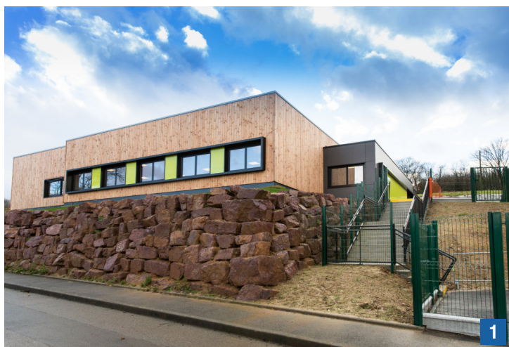
1 Vues extérieures des bâtiments